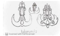
Gambar 4. Sketsa Logo Wanurejo